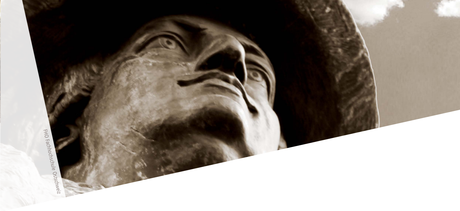
FHO Fachhochschule Ostschweiz